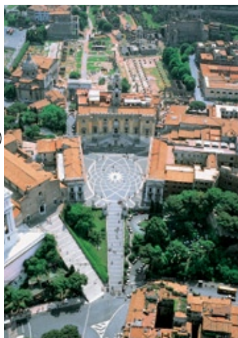
Roma, il Campidoglio

CENTRO STORICO DI ROMA • Gli itinerari possibili a Roma sono potenzialmente infiniti ma dovendo effettuare delle scelte, non si può che partire dal simbolo universalmente conosciuto della città: il Colosseo. Costruito in otto anni dalla dinastia degli imperatori Flavi, il suo vero nome era Anfiteatro Flavio e costituiva il più grande luogo destinato agli spettacoli e ai giochi dell'antichità. Lungo la strada che unisce il Colosseo a Piazza Venezia si ammirano le rovine dei Fori imperiali e del Foro Romano. Qui c'era per gli antichi romani il centro della vita pubblica, dove si concentravano le attività politiche, religiose e commerciali. Scendendo verso Piazza Venezia, spicca il Vittoriano, cioè il monumento a Vittorio Emanuele II. Al centro della maestosa costruzione, è l'Altare della Patria, con la Tomba del Milite Ignoto, dedicata ai caduti di tutte le guerre.