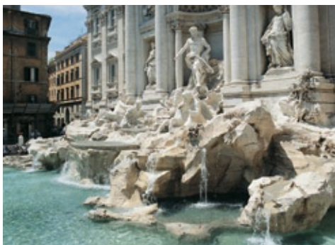
Roma, fontana di Trevi