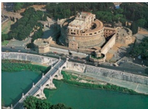
Roma, Castel Sant'Angelo