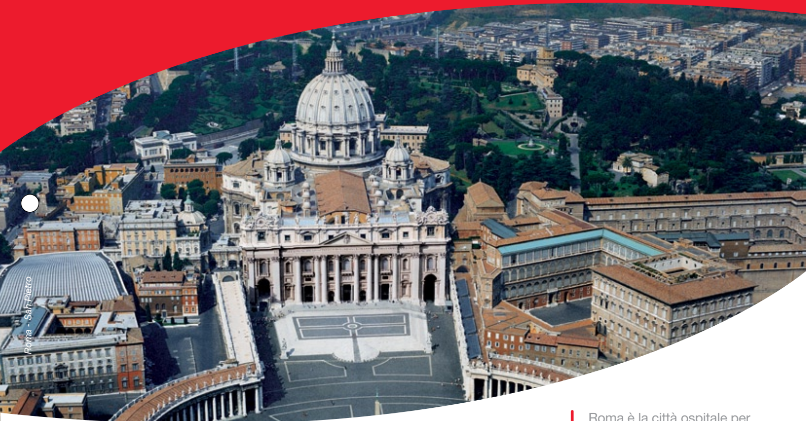
Roma - San Pietro