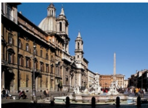
Roma, piazza Navona